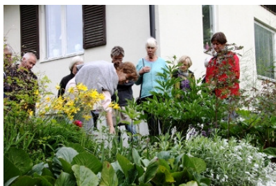
Drömparken